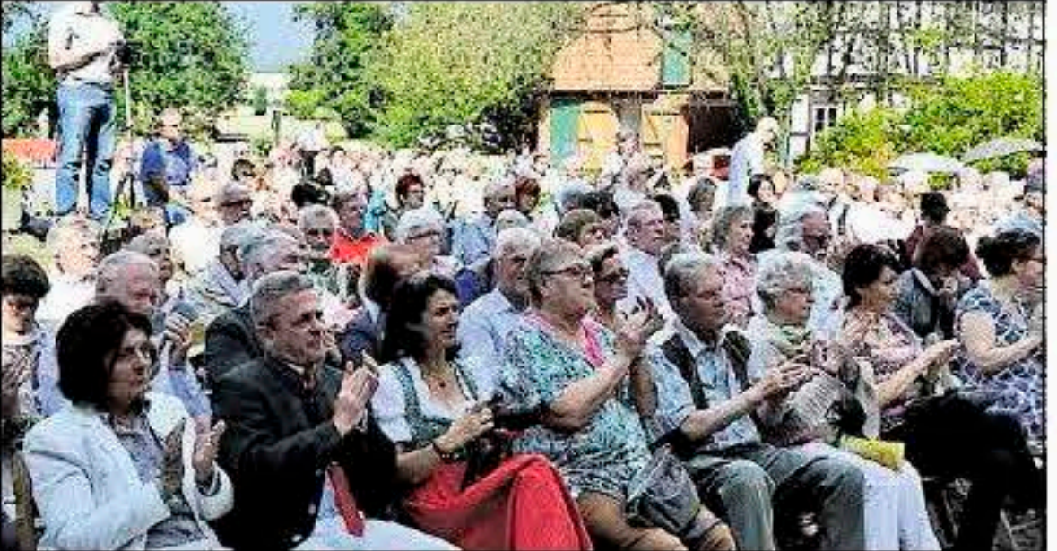
Zur Premiere sind rund 300 Besucher gekommen.

see (14. August), Bad Lauterberg (21. August) und Hannover (27. und 28. August). Auskünfte unter Telefon (0171) 9 57 20 61.