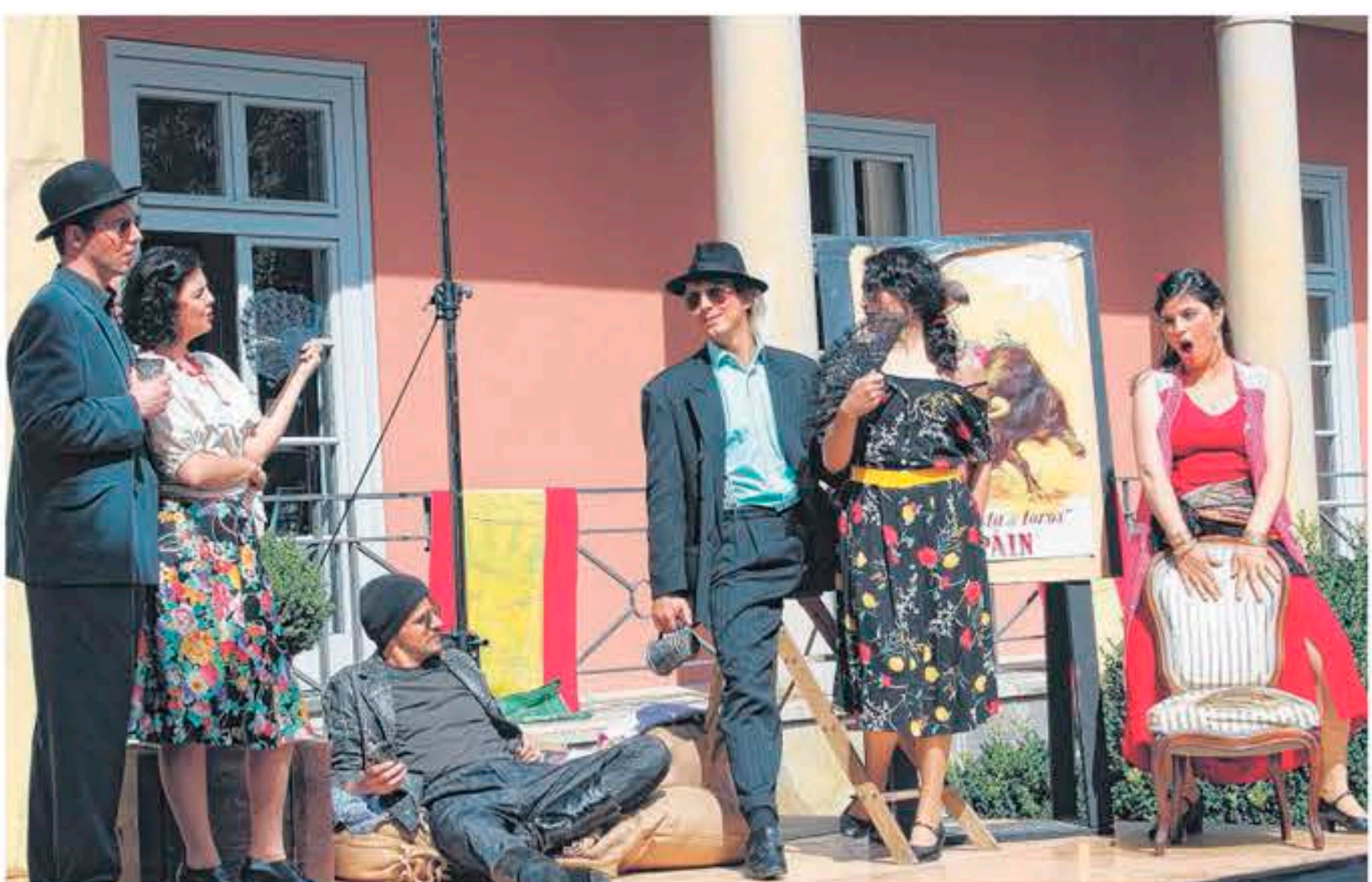
Vor zauberhafter Kulisse sangen und spielten die Sänger der „Oper auf dem Lande“ in Bad Rehburg.

Hatte im vergangenen Jahr ein Bilderbuch-Sommertag die „Oper auf dem Lande“ begrüßt, so überlegten der Projektleiter der „Romantik“, An-