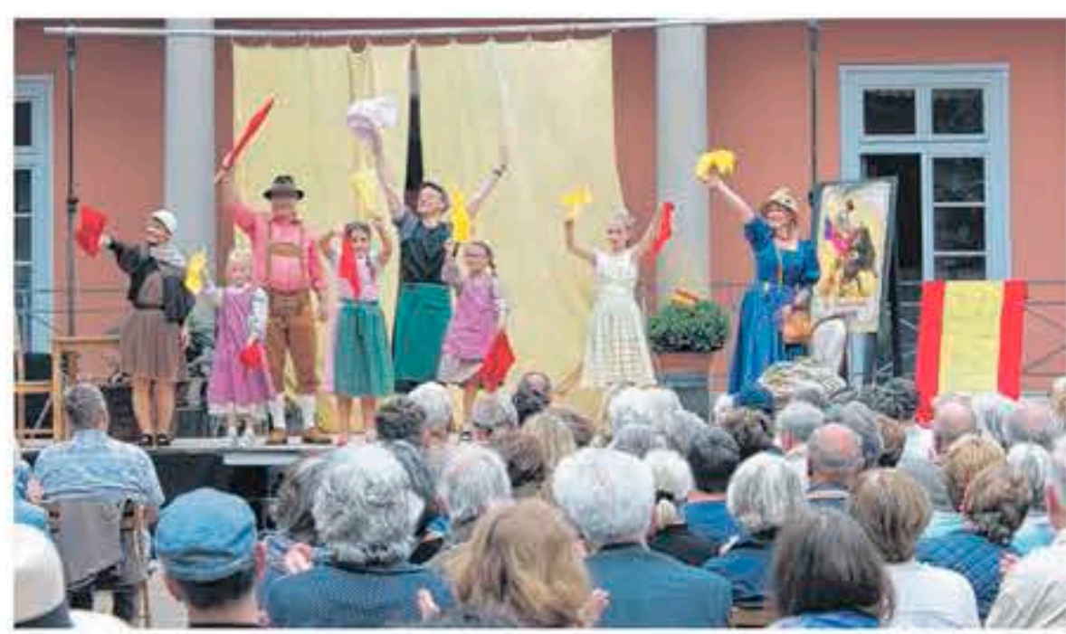
Muntere Verabschiedung: ein Ensemble von Statisten winkte den Sängern zum Ende von „Carmen“ zu, die eilenden Schrittes die Bühne verlassen.

„Oper auf dem Lande“ gastierte unter freiem Himmel in der Kuranlage