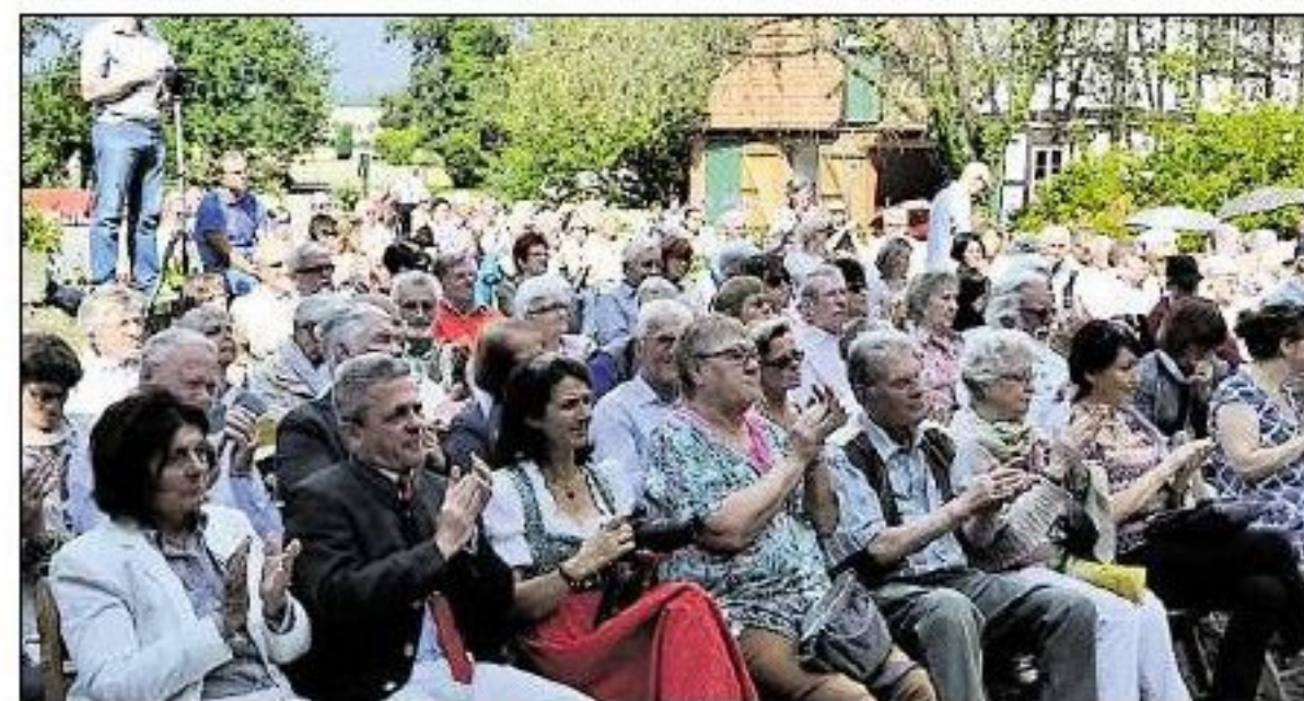
Zur Premiere sind rund 300 Besucher gekommen.

see (14. August), Bad Lauterberg (21. August) und Hannover (27. und 28. August). Auskünfte unter Telefon (0171) 9 57 20 61.